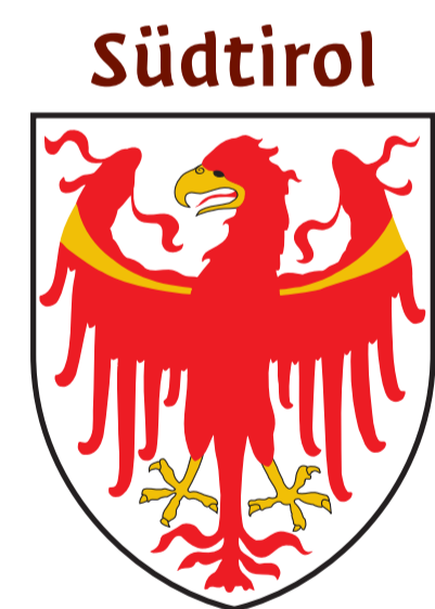
Alto Adige - Southtyrol